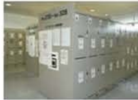
函館站投幣式置物櫃

旅途中買的東西或較重的行李若要寄放，可選擇便利的投幣式置物櫃。打開置物櫃的門，投入100日圓硬幣至所顯示的金額後上鎖。若遺失鑰匙時需要賠償，請注意！